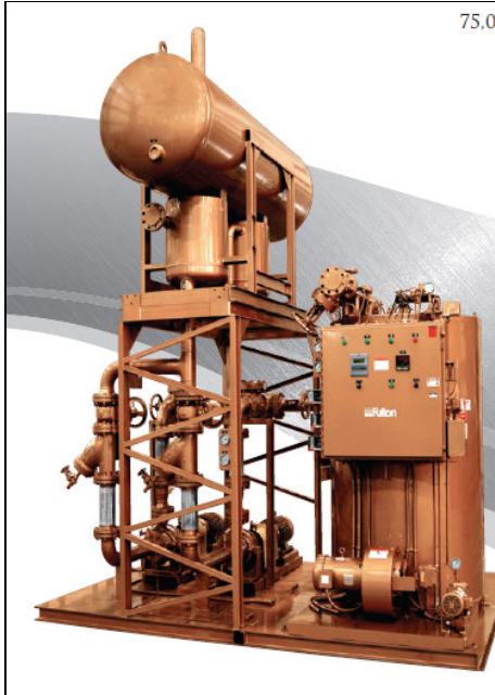
Figura N°1: Calentador de fluido térmico y equipos auxiliares.

Los fluidos térmicos o aceites térmicos no debe estar en contacto con el oxígeno del aire, ya que, a elevadas temperaturas, provocará la oxidación del fluido.